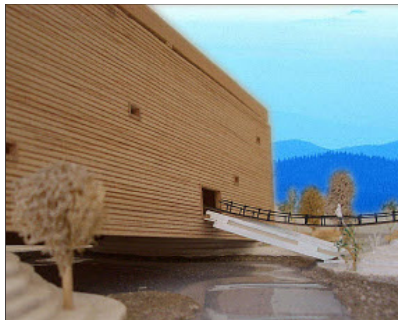
Eine Art Landungsbrücke führt zum Eingang des künftigen Salzburger Bibelhauses. Als Symbol der Hoffnung und Rettung ist das Modell des Gebäudes in Form einer Arche entworfen worden.

In Salzburg soll eine „Bibelwelt“ dem modernen Menschen die Religion mit modernen Mitteln nahe bringen – Eröffnung 2010 geplant